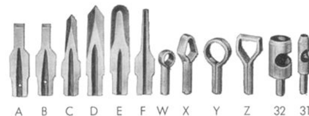
A B C D E F W X Y Z 32 31